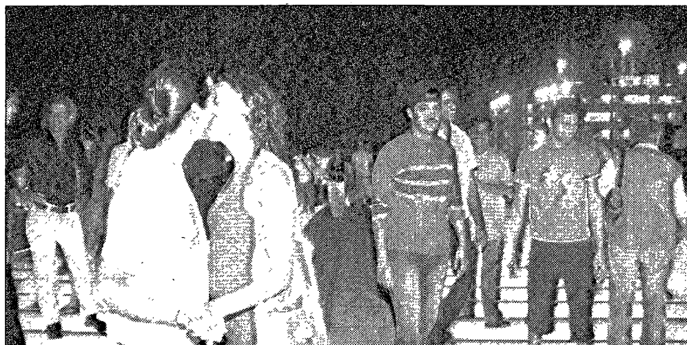
Le immagini della notte del ponte.