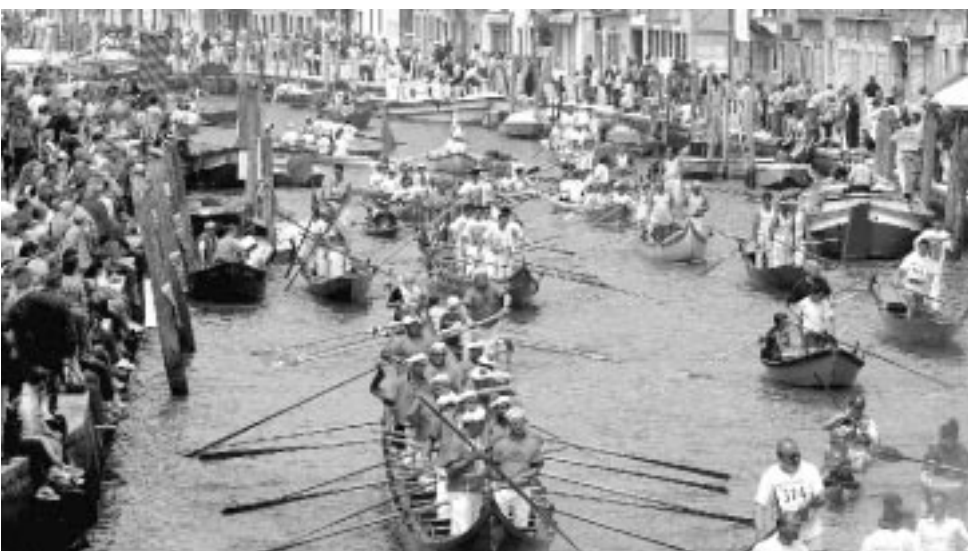
L'ultima edizione della Vogalonga ha visto una nutrita partecipazione di imbarcazioni che si ripeterà anche quest'anno