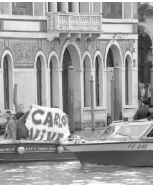
I disobbedienti bloccati dalla Polizia davanti alla Prefettura