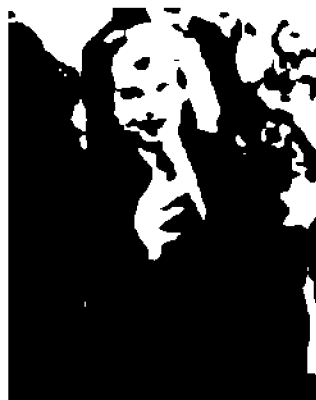
Il voto al seggio elettorale del ministro Renato Brunetta e l'incontro con la stampa e il comitato elettorale subito dopo la sconfitta